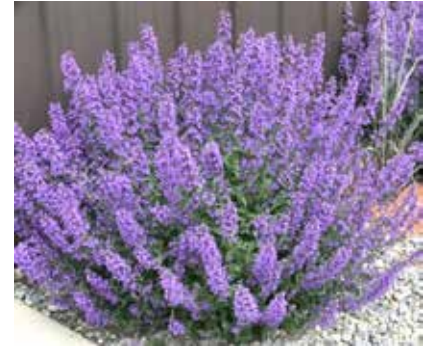
Voorbeeld Kattenkruid een hele goede bijenplant

Dit jaar willen we de winnende tuin, tuintje, geveltuin of bloembakken voor de deur belonen met aandacht en een mooi passende prijs! Uitgangspunt is dat het bijvriendelijk en diervriendelijk is.