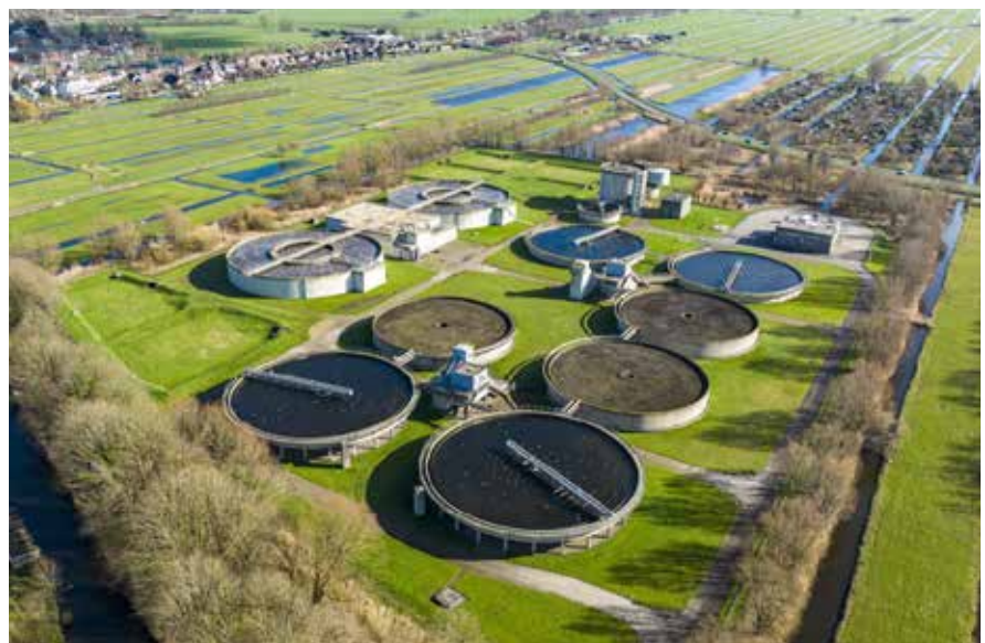
Rioolwaterzuiveringsinstallatie aan de Gouderakse dijk