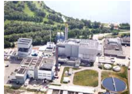
Slibverwerkingsinstallatie in Dordrecht

Rijnland is bezig met de verbouwing van de RWZI Gouda. Tot 2031 wordt eigenlijk alles vervangen, vergroot en verbeterd: de constructie, de zuiveringsprocessen, er wordt zelfs een tweede persleiding aangelegd. Ook wordt de capaciteit flink vergroot. Met dit alles voldoet de zuivering aan de in 2024 aangescherpte Europese eisen. Het is de bedoeling dat de installatie zo weer 15 jaar vooruit kan. Een fijne gedachte.