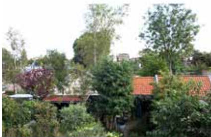
▲ voor en ▼ na de bouw

We zijn blij met het resultaat, hoewel we wel wat privacy kwijt zijn geraakt. Wij wensen onze nieuwe burens veel woongenot toe.