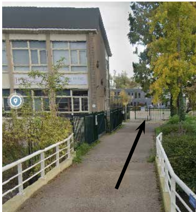
Routebeschrijving GSG Het Segment Ingang Winterdijk 4A

De school ligt achter het gebouw van Keramiekopleiding Gouda en het parkeerterrein. (De ingang in het Van Bergen IJzendoornpark is dicht!)