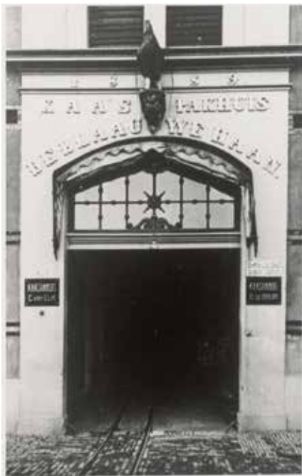
Toegangsdeur aan de Kattensingel van de kaashandelmij Gouda met opschrift 1859 kaaspakhuis De Blaauwe Haan.

Maar over een paar maanden kunnen we genieten van een bloeiende berm.