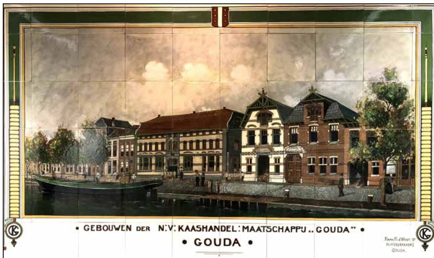
De Blaauwe Haan, zie verder blz. 3