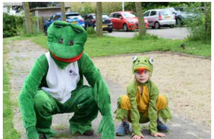
Deze grote groene kikker won de prijs voor leukste vos 2024