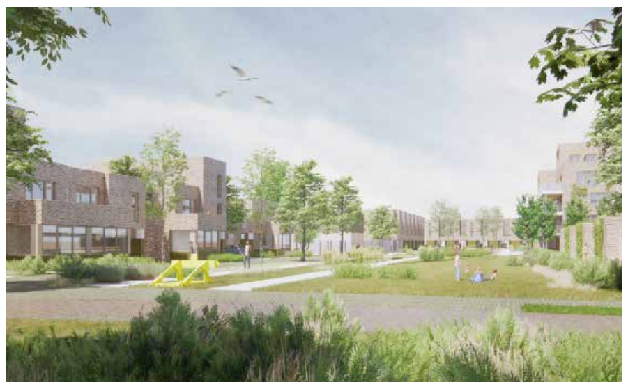
Conceptbeeld ontwikkeling Lombok terrein/ PARCOUR

De werkzaamheden van ProRail op het terrein gaan sowieso (los van deze ontwikkeling) volgend jaar van start. ProRail wil namelijk het kabel- en leidingentracé naar het relais-huis in het plangebied aanpassen en heeft hiervoor de treinvrije dagen nodig. Deze