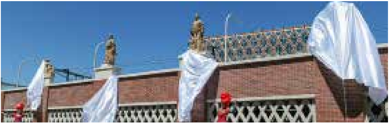
Onthulling van de 4 beelden