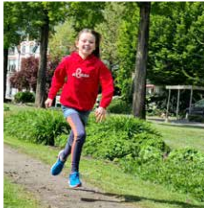
Ook jonge atleten maken gebruik van het park om te trainen

Een snelle ronde van 1000 meter is lang genoeg om een stevige cardiopulmonale trainingsprikkel aan te brengen maar kort genoeg om jezelf uit te dagen zonder dat je daar tussen de ronden door niet meer van kunt herstellen. Dit maakt de 1000 meter tot een ideale intervaltrainingsafstand. Er is in de sportschool een loopgroep voor beginnende en gevorderde hardlopers. Onder begeleiding van een vaste professionele trainer kun je op je eigen niveau werken aan je conditie en persoonlijke sportieve doelen. Bijvoorbeeld de jubileum editie van de Goudse Singelloop of (doe eens gek) de marathon van Rotterdam. Maar gewoon lekker lopen kan natuurlijk ook, voor elk loopniveau is er plek. You don't have to go fast, you just have to go.