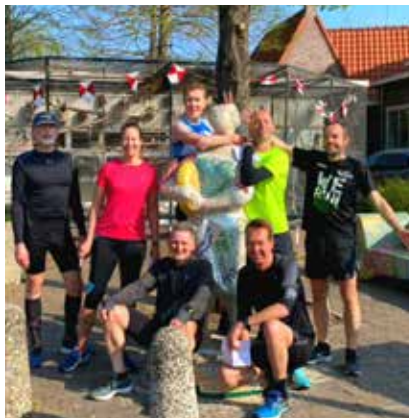
Een trainingsronde langs kaasboerinnen