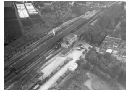
Het oude rangeerterrein met het oorspronkelijke stationsgebouw

Zo begint langzaam de transformatie van het rangeerterrein tot woonbuurt.