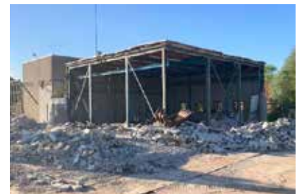
Het relais is deels gesloopt t.b.v. woningbouw