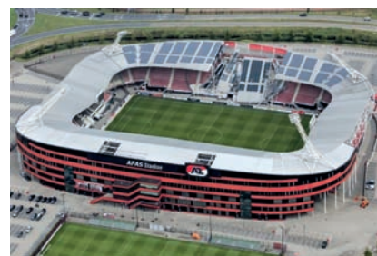
AFAS Stadion De lassers die hieraan gewerkt hebben, zijn niet bij Lasopleiding Gouda opgeleid!!!

Ieder jaar zijn er wel 1 á 2 vrouwen die de lasopleiding volgen. Wijnand zegt dat vrouwen goed zijn in Tig lassen, het fijnere laswerk. Het wordt uitgebreid toegepast voor het maken van kwaliteitslassen in de nucleaire-, chemische-, luchtvaart- en voedingsindustrie. Een paar jaar geleden was er een vrouwelijke lasinstructeur aan de opleiding verbonden. Maar die is verhuisd.