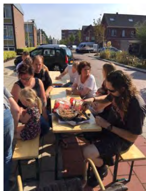
Burendag – groene speelplek