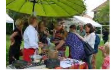
Dag van het Park