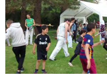
Dag van het Park