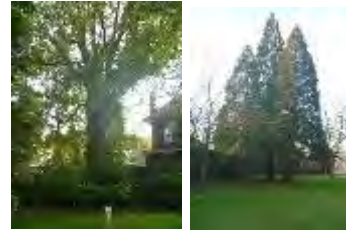
Bomen in het Park