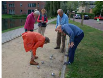
Jeu de boules