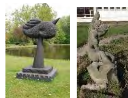
Kunst in de wijk