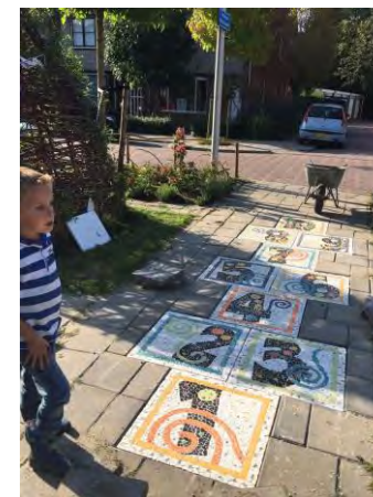
Hinkelbaan groene speelplek