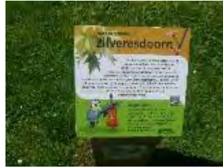
Bomenbordjes in het Park