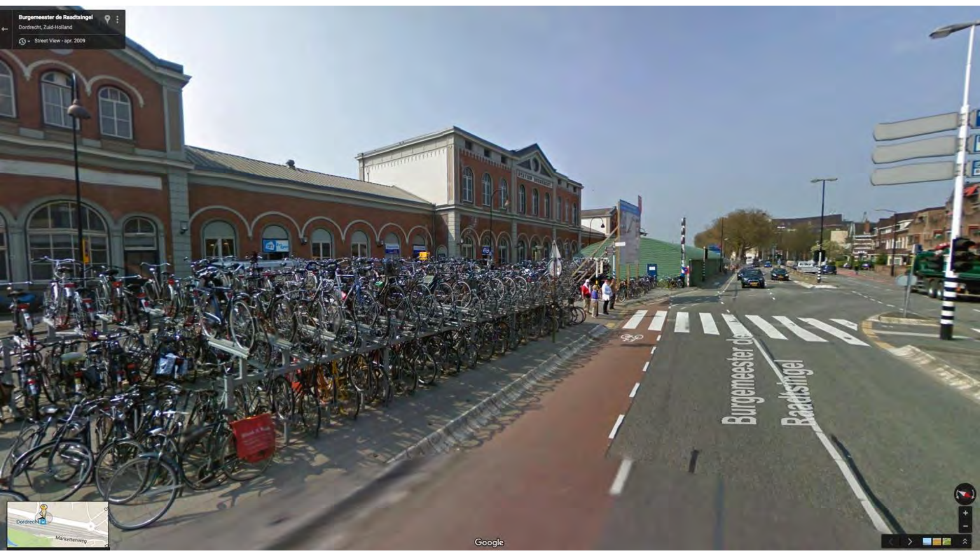
Dordrecht / Stationsomgeving