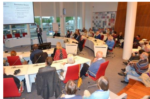
bewonersavond 2 juni in de raadszaal

Er zijn verder vele suggesties gedaan en motiveringen gegeven voor voorkeuren. We willen iedereen die aan de enquête heeft meegedaan bedanken voor deze inbreng.