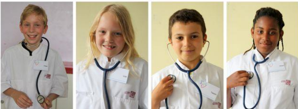
Tijdens de proefles van de dokter in 2014, mochten alle leerlingen even de doktersjas passen.

Wil je een proefles volgen en zit je nu in groep 6 of 7? Bel of mail dan met Nynke van den Brink: (06) 42 3377 86 of info@goudseweekendschool.nl Meer informatie over de Goudse Weekendschool: www.goudseweekendschool.nl