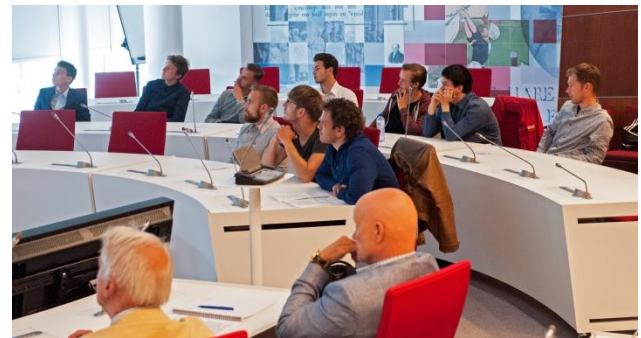
Presentatie in de raadszaal van Het Huis van de Stad

De verkeersveiligheid op de Kattensingel en bij het station moet ook beter. Met wegversmallingen, ook door het aanbrengen van groen, kan dat lukken. Zo stellen ze voor om op de Kattensingel dertig extra bomen te planten. Dat kan de projectgroep voor de herinrichting van de Kattensingel die voor volgend jaar gepland is mooi meenemen.