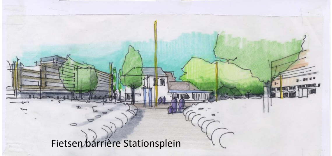
Fietsen barrière Stationsplein