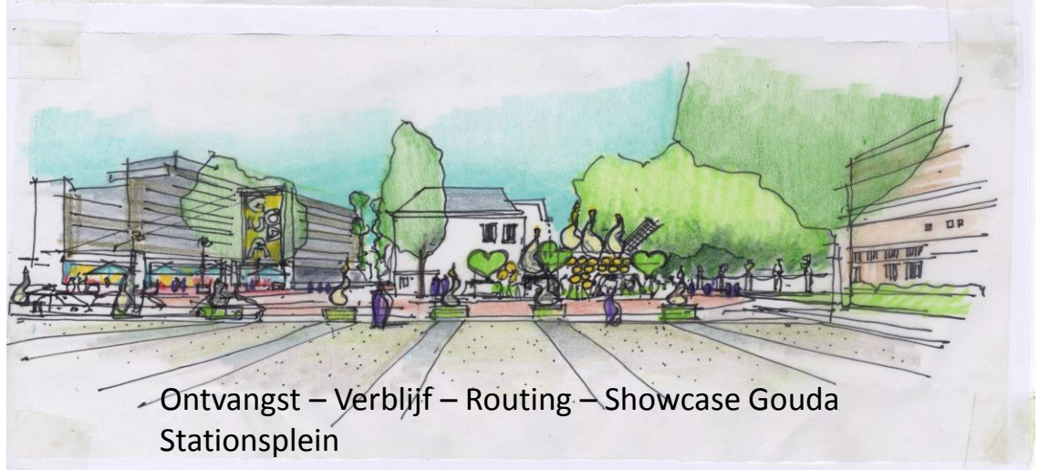
Ontvangst – Verblijf – Routing – Showcase Gouda Stationsplein