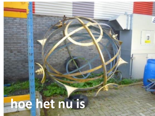
hoe het nu is