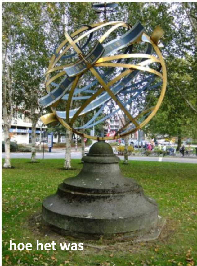
hoe het was