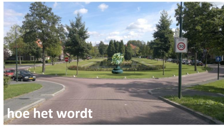
hoe het wordt