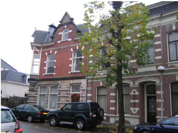
Links nr.. 41 met erker en rechts nr.. 43 met portiek

Het poortje bij nr. 13 scheidt dit pand van een huizenblok van acht, waarvan de eerste zes destijds werden aangekocht door de achtergrenzende Kaashandel Mij 'Gouda' NV. De kaashandel kreeg zodoende de mogelijkheid eventueel tot aan de Crabethstraat uit te breiden, eventueel met een spooraansluiting. Daar is het echter nooit van gekomen. De meeste van deze huizen werden zowel boven als beneden bewoond, maar geleidelijk aan werden ze samengetrokken tot enkele woningen. De huizen die dan volgen hebben in de loop der tijden uiteraard een stoet van bewoners gekend, maar daar zitten geen namen of beroepen bij die eruit springen. In de tuin van huisnummer 39, die ooit grensde aan de Jan Verzwollewetering, is begin jaren negentig een kantoorpand gebouwd.