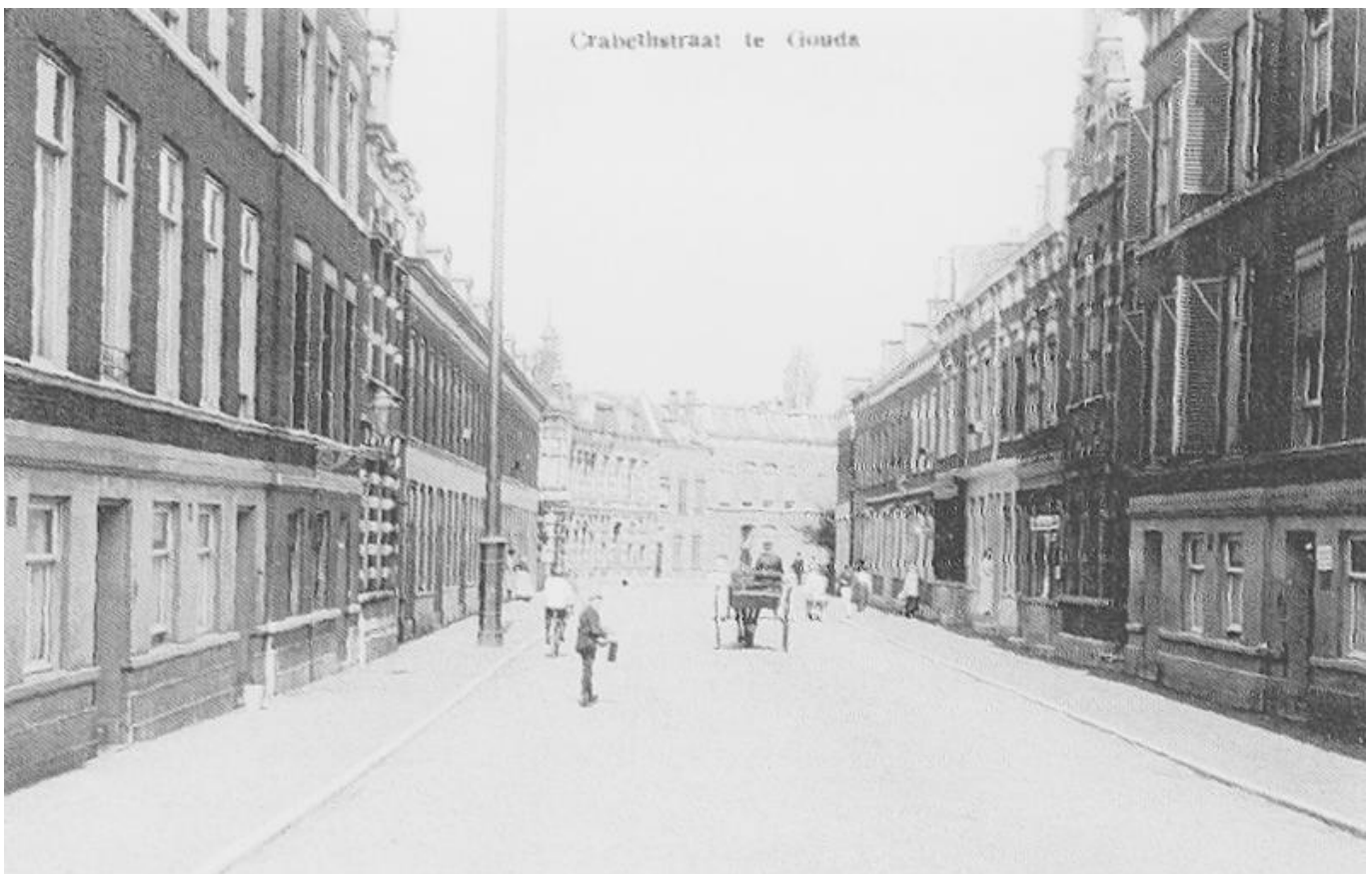
Crabethstraat vanaf de Kattensingel in 1918

leninstituut in. Vervolgens verkocht de volgende eigenaar het pand eind jaren zestig aan de Italiaan Vitale, die er Turkse gastarbeiders in huisvestte. In het pand daarnaast op nr. 7 kwamen op een gegeven moment ook Turkse gastarbeiders te wonen. In het laatste pand van dit huizenblok, op nr. 9, woonde de bekende dr. Montagne van de voormalige Montagne (kraam)kliniek op de Westhaven. Dit pand nr. 9 was dusdanig verzakt, dat het in de vijftiger jaren met de grond gelijk werd gemaakt. Dit is tientallen jaren braakliggende grond geweest. Toen ook de eerste vier panden rijp waren voor de sloop, kwam er in de tachtiger jaren ruimte voor flats, op de hoek van de Crabethstraat en de Kattensingel tot en met de sigarenwinkel van Hoogeveen, die toen ook werd afgebroken.