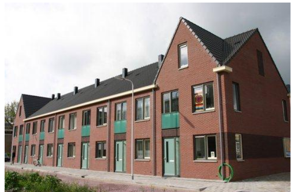
Dit blokje staat aan de kopkant van de Noorderstraat op de plek van Hoogvliet, tegenover Gouwestein

huisraad wegdenkt zie je een ruime, lichte woonkamer met open keuken. De voorkant bij de keuken kijkt uit op het Binnenhof, de achterkant op het groen van de Winterdijkwoningen. Hij moest er eerst nog achteraan om de eerste keus te hebben als terugkeerder, want zijn naam kwam door administratieve slordigheid niet op de lijst voor. Toen dat is rechtgezet heeft hij meteen dit kavel gereserveerd. Het huurcontract tekende hij alleen onder voorbehoud van alle rechten, onder protest tegen de ingangsdatum van de huur, 12 juli. Op de voorlichtingsdag was namelijk gemeld dat de oplevering augustus of september zou worden, waarmee met de voorbereiding van de verhuisplannen werd rekening gehouden. Er lag nog geen weg zo vlak voor de bouwvak en dat maakte verhuizen praktisch onmogelijk. Vlak voor de oplevering van de woning is de straat alsnog aangelegd.