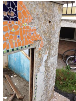
het kapotte mozaïekhuisje

Afgelopen burendag was het de bedoeling dat het mozaïekhuisje in ere hersteld zou worden. Tijdens de voorbereidingen bleek de staat van het huisje zeer slecht te zijn en had het geen zin om verder te gaan met de voorbereidingen. Bij de bouw van het huisje is er helaas niet voor duurzaam materiaal gekozen, en dat geldt zowel voor de tegels als voor de ondergrond. De tegels waren niet vorstbestendig en geplakt op houtvezelplaat. Beide materialen zijn niet geschikt om met vocht en vorst in aanraking te komen. Het raamwerk van het huisje was ook helemaal verrot en er was helaas geen eer aan te behalen.