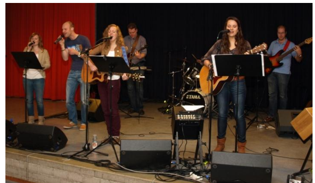
Muziek op zondagochtend

enthousiasme over het geloof. Parousia betekent letterlijk: komst, wederkomst, aanwezigheid. In dit verband wordt bedoeld: de voortdurende aanwezigheid van Jezus in ons leven en het uitzien naar Zijn wederkomst. Parousia maakt onderdeel uit van CAMA, Christian and Missionary Alliance, een zendingsgenootschap dat eind 19de eeuw is ontstaan in de VS en via Nederlands Indië ook in Nederland terecht is gekomen. De zending is erg belangrijk voor de gemeente. Haar missie luidt dan ook "samenwerken om ongelovigen te maken tot volledig toegewijde volgelingen van Jezus Christus. Dit onder de leus van A tot Z, dat wil zeggen van Atheïst tot Zendeling."