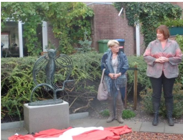
v.l.n.r. de Uil, het uiltje en de wethouder