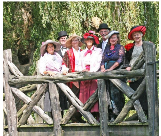
Dit is niet de troonrede

En als u er bent geweest heeft u vast en zeker de fraai uitgedoste dames gezien. Zij droegen lange rokken en hadden prachtige hoeden op. Daarnaast liepen de heren in jacquet met vest en hoge hoed. Het was een bont gezelschap in kleding van vroeger, toen flaneren in het park nog heel gewoon was.