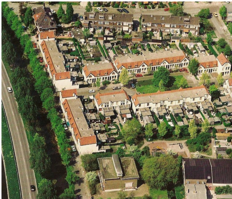
Luchtfoto van het Rode Dorp (links de weg langs de Nieuwe Gouwe, het tussen 1898 en 1903 gegraven kanaal)

De tuinstadgedachte in Nederland is gebaseerd op de visie van de "Garden City" van Ebenezer Howard. Hij beschrijft een utopische stad die de voordelen van het open, groene platteland combineert met de voordelen van de stad, zoals voorzieningen. De tuinstadgedachte gaat uit van kleinschalige opzet, lage bebouwingsdichtheid, afwisselende aanleg, eengezinswoningen met een tuintje voor en achter en met gemeenschappelijke voorzieningen als winkels en badhuizen. De stedenbouwkundige opzet wordt gekenmerkt door architectonische accenten op de hoeken, verspringende rooilijnen, afwisseling van hogere en lagere delen, groenstroken, waterpartijen en dergelijke.