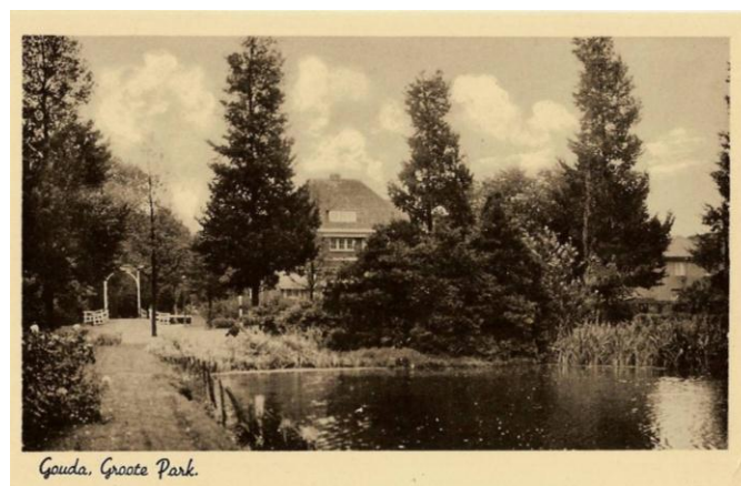
Het Nieuwe Park tussen Winterdijk en Nieuwe Gouwe O.Z. ( op achtergrond Huize Elisabeth)