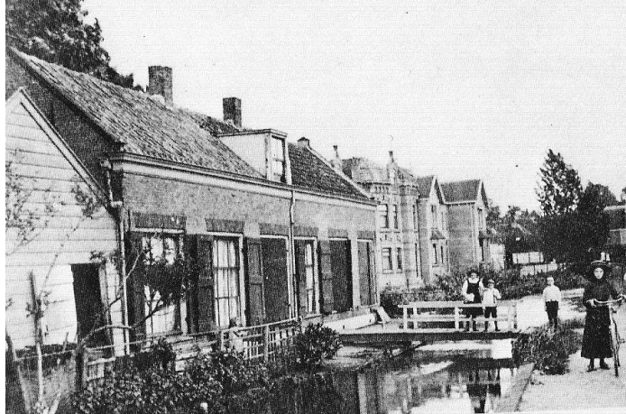
Van Strijenstraat/Winterdijk (op de achtergrond de Piersonweg)

Het kantoorgebouw van de Zeepfabriek zal eveneens worden gesloopt. Ook voor deze locatie is een nieuwbouwplan in voorbereiding. Singelstaete en de "nieuwbouw" langs de Van Strijenstraat en Van Vreumingenstraat zijn halverwege de jaren negentig gebouwd op een deel van het terrein van de Goudsche Machinefabriek.