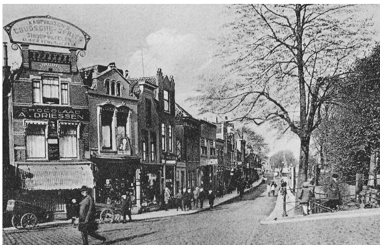
Spoorstraat (waar nu de Spoor tunnel ligt)

In het hart van de wijk vindt u een mooi stadspark. Het eerste deel van het park is in 1901 aangelegd. Het is aangelegd in de landschappelijke stijl, die op dat moment in de mode was. De aanleg van het park is gefinancierd uit een speciaal daarvoor bestemd legaat van burgemeester A.A. Van Bergen IJzendoorn (1824 - 1895). Aan de stationskant wordt het park begrensd door de Leeuwenpoort, vroeger de buitenpoort bij de Kleiweg. Later is het symmetrische deel van het park aangelegd. Het park is o.a. een gemeentemonument geworden omdat het een fraai voorbeeld is van een stadspark in landschapsstijl buiten de singels, de oorspronkelijke beplantingsstructuur grotendeels is gehandhaafd en de stedenbouwkundige ligging van groot belang is.