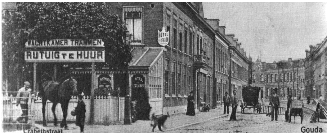
Crabethstraat (vanaf het station gezien)

De Van Strijenstraat is al op de kaart van Van Deventer van omstreeks 1562 te vinden. De straat wordt pas sinds 1903 Van Strijenstraat genoemd, een vernoeming naar burgemeester Willem van Strijen (1687 – 1768). Daarvoor maakte het deel uit van de Winterdijk. De Winterdijk is één van de oudste wegen naar/van Gouda en wordt al in 1359 vermeld. De naam houdt verband met de functie: bescherming tegen wateroverlast in de winter in de oostelijke Gouwelanden. De dijk moest voorkomen dat de ontgonnen landerijen onder water liepen. Aan het einde van de Winterdijk bevindt zich een oerbosje, het laatste restant van de moerasbossen die vroeger rondom Gouda te vinden waren.