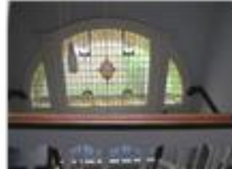
Details uit het rijksmonument Van Beverninghlaan 36

De woning aan Van Beverninghlaan 36 is een mooi voorbeeld van de eclectische bouwstijl. Het huis is grotendeels gebouwd in 1916, maar omdat de aanvoer van zandsteen in de oorlog was vertraagd pas in 1918 afgebouwd. In het pand zijn interieuronderdelen gaaf bewaard, zoals een mooi trappenhuis met houten bordes en baluster met snijwerk.