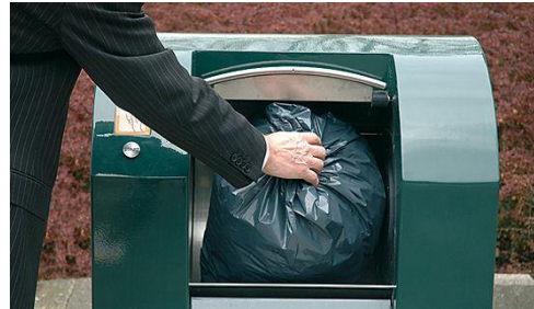
Er kunnen ongeveer 80 vuilniszakken in een ondergrondse container