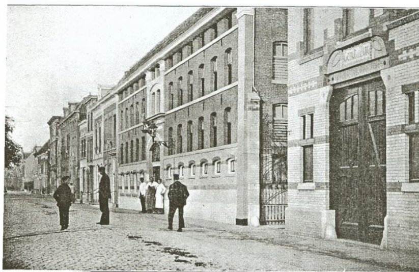
Kantoor en pakhuizen aan de Kattensingel in 1903