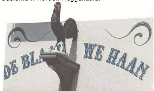
De Blaauwe Haan

In 1801 werd een "koophuis en erve met lijnbaan en drie paden" omgebouwd tot "bleekerij", genaamd De Blaauwe Haan. Vastgelegd was dat na de koop deze naam nog 13 jaar en 4 maanden niet veranderd mocht worden. Het perceel was inmiddels verdubbeld en een aantal malen van eigenaar gewisseld. Het pand had in het midden een kade of poort: De Blauwe Poort, die was afgesloten met een ijzeren draaihek; dit was de ingang voor lossen en laden. Dit pad was destijds openbare weg tussen diverse percelen. Rond 1920 verkocht firma Eyssen zijn kaaspakhuis aan firma Paul in de Jeruzalemstraat en eigenaar Eyssen verhuisde naar Alkmaar. Dit gebouw stond ooit op het stuk Kattensingel waar de Van Swietenstraat is aangelegd in 1921. Paul werd de latere eigenaar van de kaashandel. Gedwongen door uitbreiding kwam het bedrijf toch weer in Gouda terug op de plek waar de Blaauwe Haan heeft gezeten. Het werd de voortzetting van twee bedrijven, die vroeger samen als kaashandel aan de Kattensingel zaten, maar nu onder één dak. De haan op de gevel werd in bruikleen afgestaan: bij opheffing van de kaashandel of bij verhuizing moet het beeldmerk worden weggehaald.