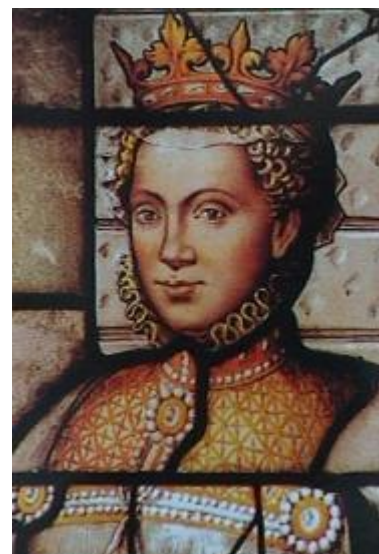
Detail van het raam dat Dirck maakte in opdracht van Margaretha van Parma

Maar wat laten de glazen zelf zien? Het bijzondere van de beide broers Crabeth is dat zij niet alleen het glas, maar ook de ontwerpen (de cartons) zelf maakten. Daardoor zijn de ontwerpen los, bijna expressionistisch opgezet. De glazen zelf blijven echter de mens verbazen. Niet alleen door de ontwerpen, het tekentalent, het gevoel voor kleuren en de beheersing van de techniek die eruit spreekt. De Goudse Glazen waren door Dirck in de eerste plaats bedoeld om van te leren. Zij vertellen een geschiedenis, eigenlijk twee: die van Johannes de Doper (St. Jan is immers de patroonheilig van de stad Gouda) en van Christus zelf. En die geschiedenis moest goed begrepen worden. Erasmus, een van de beroemdste burgers van onze stad, komt hier om de hoek kijken. Erasmus was van mening dat je zelf op het woord van Christus moest vertrouwen en dat tussenkomst van kerkelijke geleerdheid, sacramenten en/of andere instanties overbodig was. De gebroeders Crabeth zijn beïnvloed door hem. De vaste voorstellingen die je ziet in andere kerken, hebben plaats gemaakt voor minder bekende thema's met verklarende teksten erbij. De bedoeling was immers een beter mens te worden van het kijken naar de glazen. En kijken deed men en doet men nog steeds. Al eeuwen lang (wordt vervolgd).