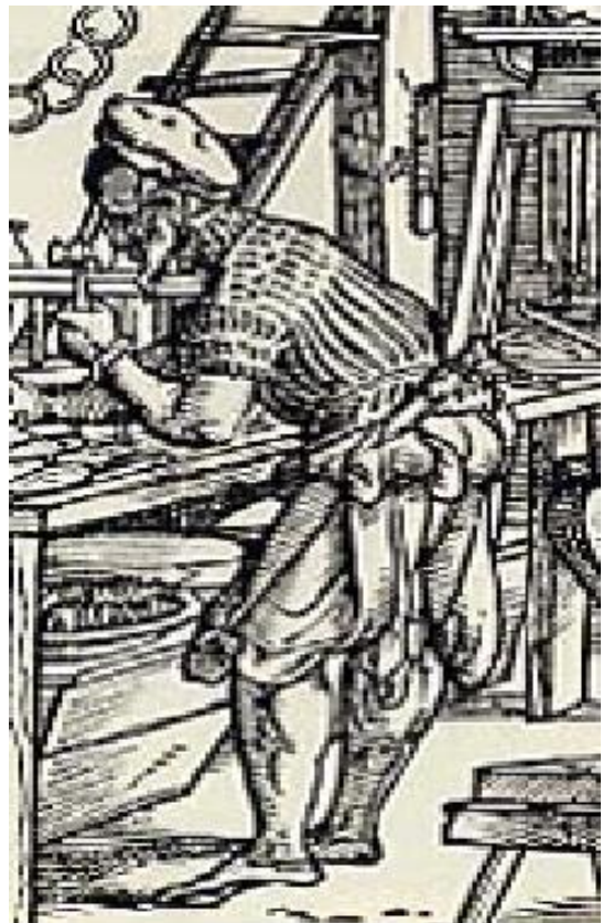
Een glasmaker aan het werk

als tekenaar. Hij krijgt van diverse instanties, waaronder het Hoogheemraadschap, opdrachten om kaarten te maken van bijvoorbeeld de loop van de IJssel. Ook van Dirck zijn van voor 1552 al twee grote glazen bekend: in de Grote of St. Jacobskerk in Den Haag. Zij dateren uit 1541 en 1547 en kunnen beschouwd worden als voorlopers van de Goudse Glazen. Ook zijn er nog een aantal kwitanties gevonden, waarop te lezen is dat Dirck betaald heeft gekregen voor het tekenen en/of vervaardigen van "glazen", die echter nu niet meer bestaan (o.a. voor het Catherineconvent te Utrecht). Het spreekt vanzelf dat niet alleen de tijd veel heeft vernietigd, de mens heeft daar ook een behoorlijk handje aan meegeholpen: in 1568 immers breekt de tachtigjarige oorlog uit en 1572 is het jaar van de Reformatie. In dat licht gezien is het eigenlijk een klein wonder dat er zoveel werk van Dirck en zijn broer Wouter Crabeth bewaard gebleven is.