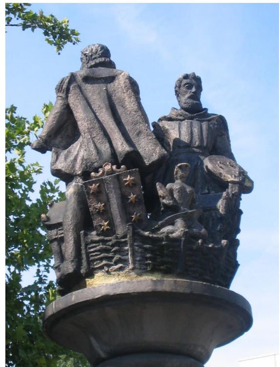
Wouter Crabeth kijkt op u neer bij het station

Na 1566 houdt Wouter zich bezig met de restauratie van de glazen in de St. Janskerk en dat blijft hij doen tot zijn dood in september 1589. Deze Crabeth heeft wel nakomelingen gehad. Drie van hen sterven heel jong, maar zijn zoon Pieter wordt later niet alleen burgemeester van Gouda, maar ook gecommiteerde in de Staten van Holland. En vele Crabeths zullen hem in de loop der eeuwen volgen in deze politieke ambten. Wij echter zullen - als we lopen of fietsen door de Crabethstraat - misschien nu toch een beetje anders om ons heen kijken. Wat een uitzonderlijk talentvolle broers zijn dit geweest, wat een fascinerende geschiedenis steekt er onverwacht achter een onopvallend naambordje.