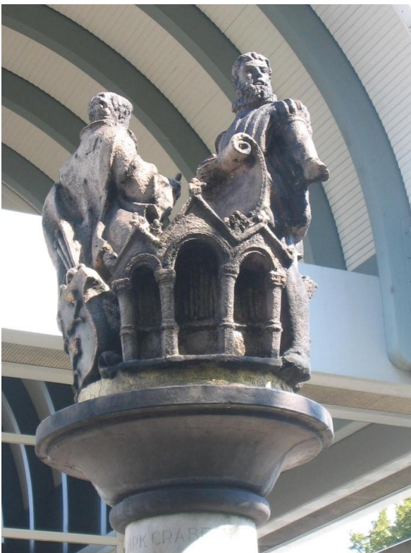
Dirck Crabeth kijkt op u neer bij het station

Dirck Crabeth heeft niet alleen glas-in-lood gemaakt. Er zijn ook tekeningen van hem bewaard gebleven, ontwerpen van wandtapijten en zelfs bouwkundige kaarten. Dirck is ook enige tijd kerkmeester geweest, toen hij begon met de glazen in 1553. De kerkeraad was immers zeer nauw betrokken bij de voorstellingen die op de glazen zouden moeten komen. Kortom: Dirck was een gezien burger met representatieve functies, bepaald geen kunstenaar die zich alleen op een zolderkamertje liet inspireren. Ook is Dirck getrouwd geweest. Er is een acte gevonden uit 1557 waarin melding gemaakt wordt van het overlijden van "Dirck Pieterz. Wyf", juist het jaar waarin hij zijn mooiste glazen maakte. Over kinderen is niets bekend. In 1564 verhuist hij naar de westzijde van de Gouwe (tegenover de Turfmarkt). Dirck overleeft zijn vrouw lange tijd, op 14 november 1574 wordt hij begraven.