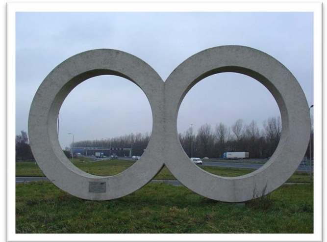
beeld bij A12 voor 100 jr Nederhorst

In opdracht van Nederhorst werd ter gelegenheid van het honderdjarig bestaan een beeld gemaakt bestaande uit twee enorme ringen. Het werd naast het kantoor in Gouda geplaatst. Dit beeld moest echter ruimte maken voor de uitbreiding van de parkeerplaats en sinds 1998 staat het 35 ton wegende gevaarte langs de A12 bij Gouda.