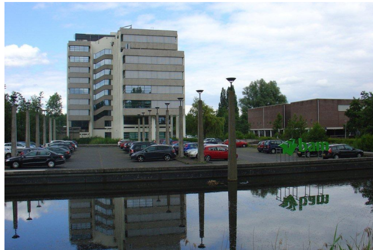
BAM-gebouw aan de Nieuwe Gouwe O.Z. door G. v.d.Gaarden

Na de Tweede Wereldoorlog richtte het bedrijf zich meer op het buitenland. In West-Afrika werd in 1958 de Afrika Construction Company opgericht. Hong Kong en Singapore kwamen erbij. Langzamerhand vond de directie het nodig het bedrijf te reorganiseren en uit te breiden met vele bedrijven. In 1964 werd het familiebedrijf omgezet in de Holdingmaatschappij Verenigde bedrijven Nederhorst met als dochters de NV tot aanneming van werken v/h Nederhorst en N.V. Bouwmij Nederhorst Curaçao.