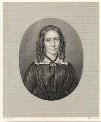
Mevrouw Bosboom Toussaint

Anna Louisa Geertruyda Toussaint, geboren in 1812 schreef in 1837 haar eerste boek. Zij komt uit een apothekersgezin en werd "huisonderwijzeres". Na een mislukte verloving trouwde zij uiteindelijk met met de schilder Johannes Bosboom. Zij was toen al 39 jaar, in die tijd echt een "oude vrijster". Maar schrijven lag haar het meest na aan het hart. Haar meest bekende boek is "Het Huis Lauwernesses", wat de ouderen onder ons zich misschien nog wel herinneren. Een dik boek over de strijd tussen de katholieken en de protestanten in het begin van de 16de eeuw.