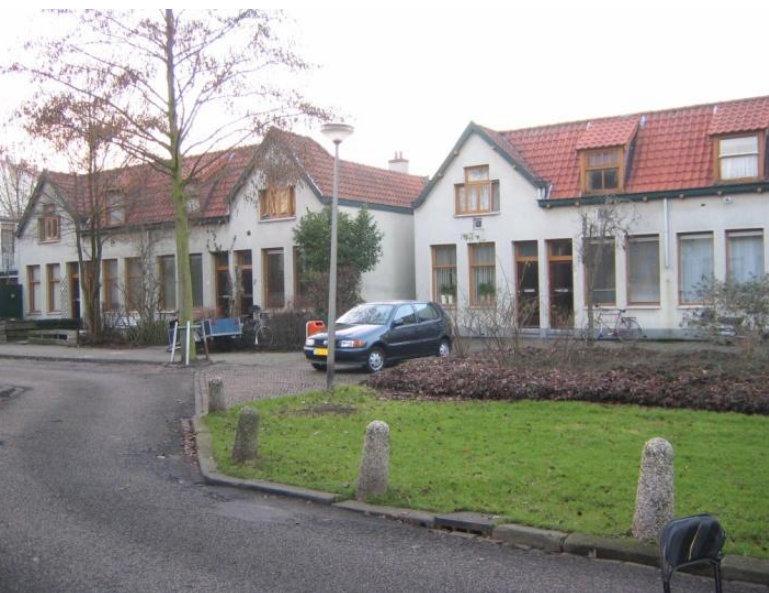
Parkstraat, groene hart van het Rode Dorp

hij de Haagse architect J. Duynstee opdracht tot het ontwerpen van een 'landhuis'. De ontwerp-tekeningen van het bouwwerk zijn bewaard gebleven. Daaruit blijkt dat er aan het exterieur van het gebouw eigenlijk nog weinig is veranderd. Het werd uitgevoerd in een zakelijk-expressionistische stijl waarbij de architect veel verticaal metselwerk toepaste. Het terras met uitzicht over het Nieuwe Park werd geheel in baksteen uitgevoerd en boven de entree zijn sculpturen in de vorm van leeuwen geplaatst. De oorspronkelijke indeling van het pand was zeer luxueus. In de kelder bevonden zich naast verschillende bergplaatsen, een hok voor de centrale verwarming met ernaast de kolenopslag, een wijnkelder, een mangelkamer, een rijwielbergplaats en een donkere kamer. De begane grond bezat een enorme hal met aan een kant de keuken en aan de andere kant een spreekkamer. Aan de achterzijde bevonden zich twee grote salons en een enorme serre die uitkwam op het terras. Ook de indeling van de verdiepingen was zeer ruim van opzet waaronder twee kamers voor de dienstboden.