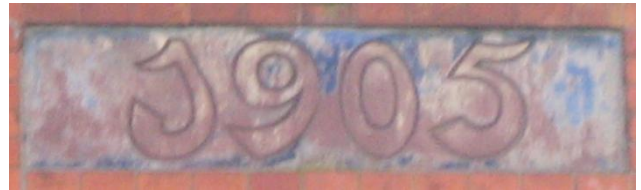
detail gevel Van Beverninghlaan 23

allemaal met de natuur en het park te maken hadden.