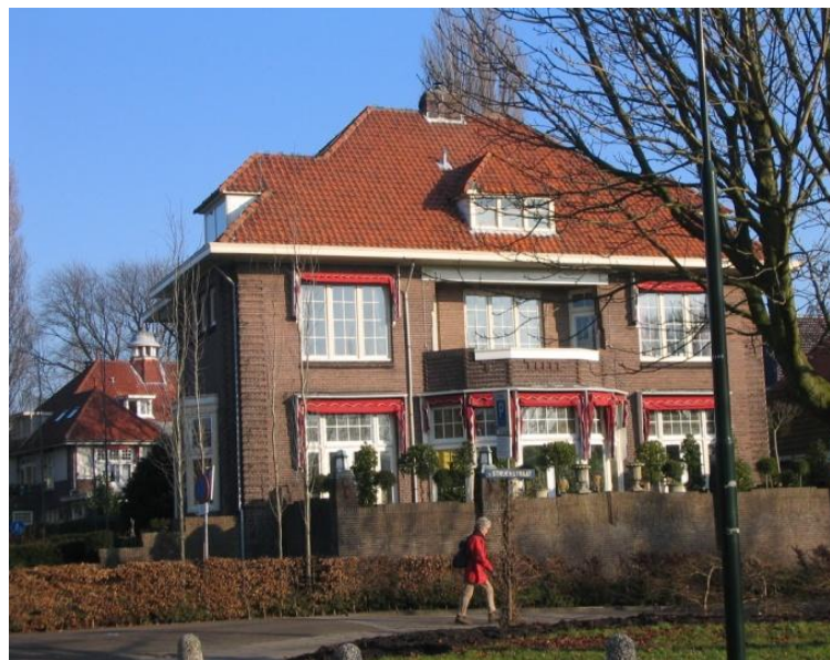
achterzijde Huize Elisabeth