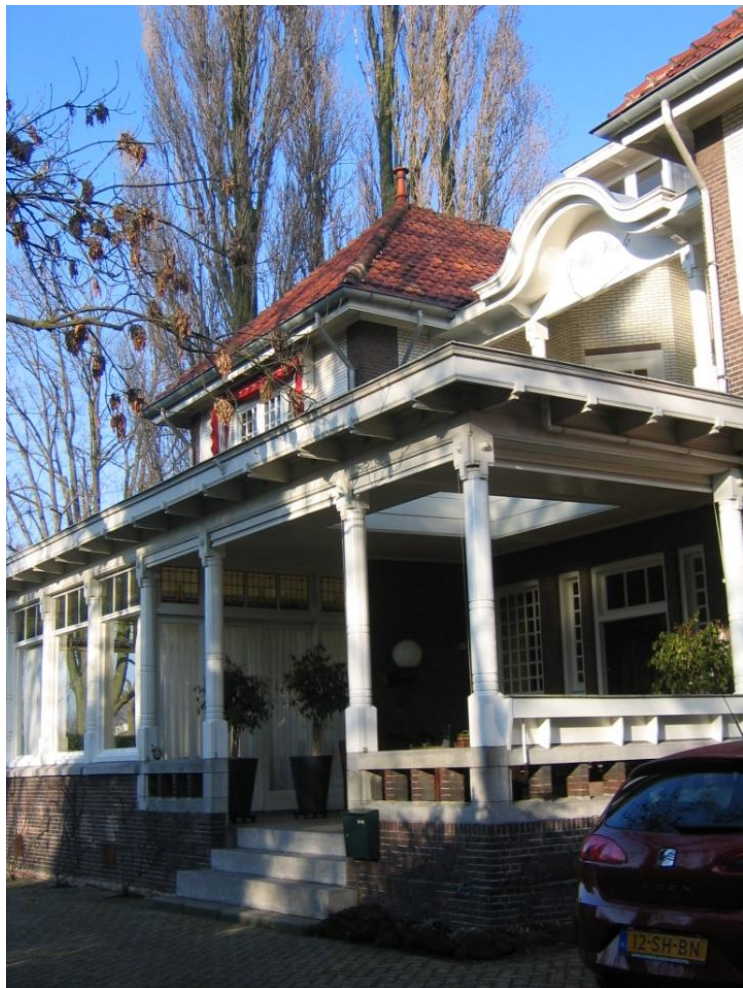
entree Villa Honk