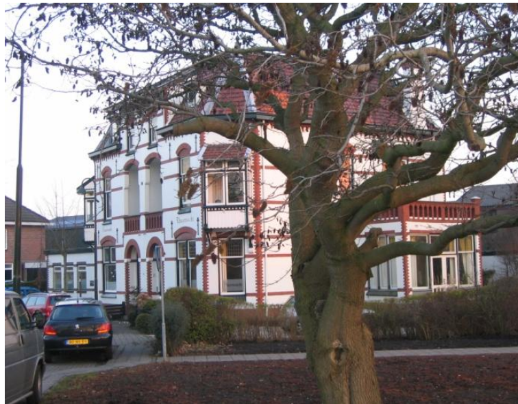
Villa Rhuysicht / Sonnevanc

hoekblokken zouden dus de enige bebouwing in dit park zijn. In de loop van de tijd zijn de groenstroken echter bebouwd en zijn de wandelpaden van toen vervangen door geasfalteerde wegen.