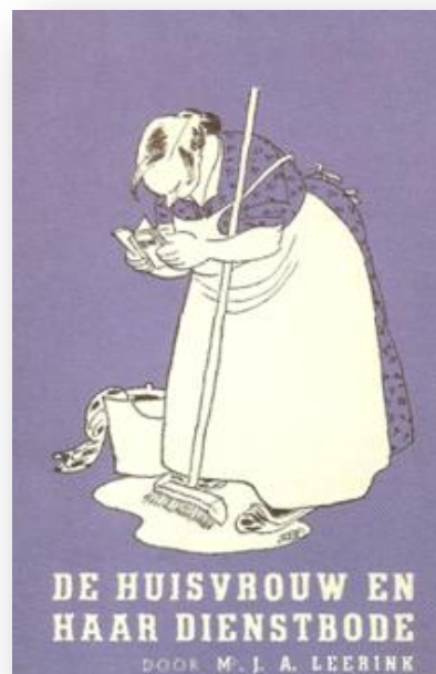
Een boekje met tips als je een dienstbode aanneemt.

Al vele jaren probeert de regering een verplichte ziekenfondsverzekering in te voeren. De directie van de M.V.Z. voelt de bui al hangen en vreest dat vrijwillig verzekerden, die onder de loongrens gaan vallen, hun polis zullen opzeggen. Om het verlies voor te zijn introduceren ze ook andere verzekeringsvormen, vallend onder de afdeling Varia: de brandverzekering, de rijwielverzekering en de dienstbodeverzekering.