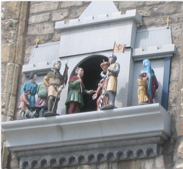
Het carillon aan de zijgevel van het stadhuis