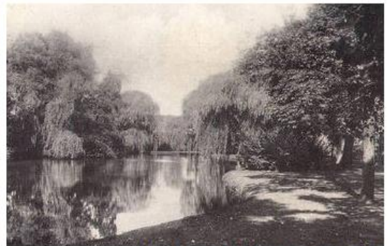
VAN BERGEN IJZENDOORNPARK GOUDA