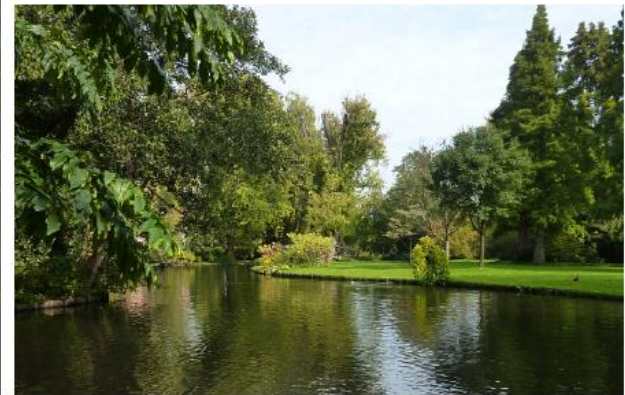
fig. 2.1-5 Aanzichten hedendaags